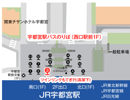
JR宇都宮駅西口バスターミナル ③番のりば