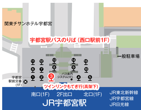
JR宇都宮駅西口バスターミナル③番のりば