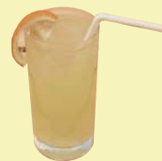
生しぼり柚子 はちみつジュース 料金:300円

夏の定番と言えば、やっぱりかき氷！イチゴ、メロン、レモン、ブルーハワイの4つの味を用意しています。