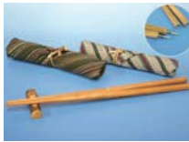
携帯お箸(箸袋付き) 料金:1500円