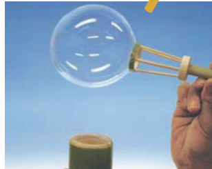
シャボン玉 料金:500円