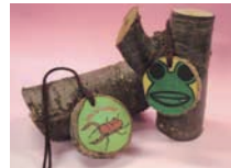
森のメダル 料金:各500円