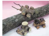
森のレーシングカー 料金:各500円