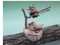
小枝のクラフト 料金:500円