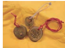
森のアクセサリ 料金:各500円