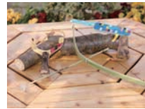
のあてオモチャ 料金:各500円