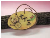
ルームプレート 料金:500円