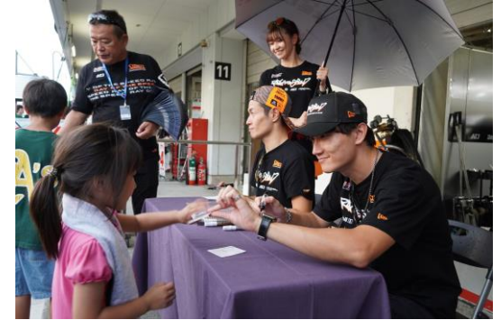
SUPER GT キッズエクスペリエンス