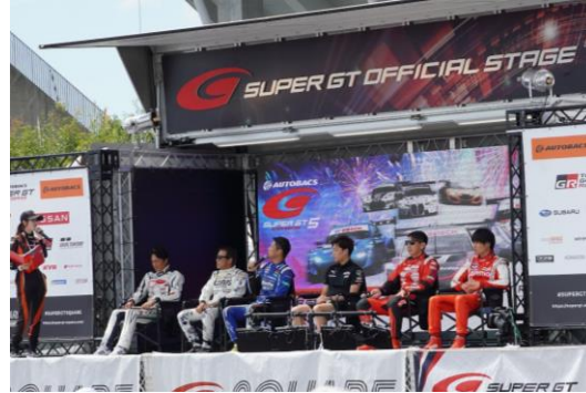
ドライバートークショー