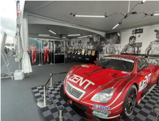
TOYOTA GAZOO Racing