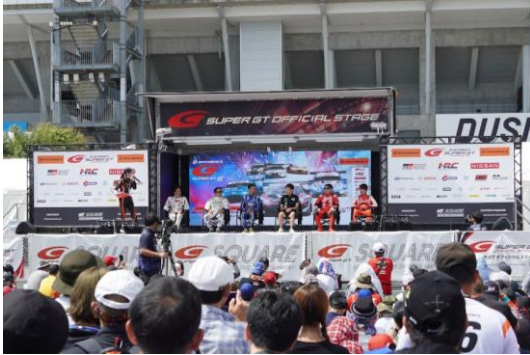
ドライバートークショー