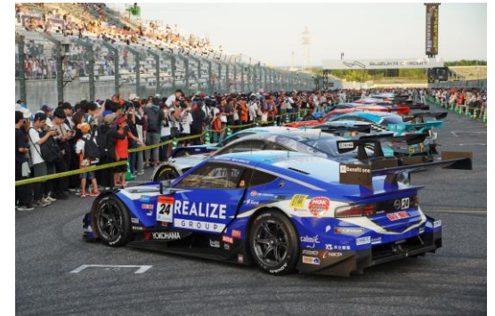
パルクフェルメウォーク