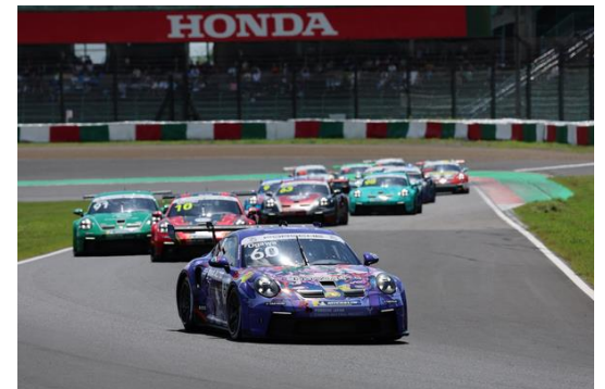
Porsche Carrera Cup Japan