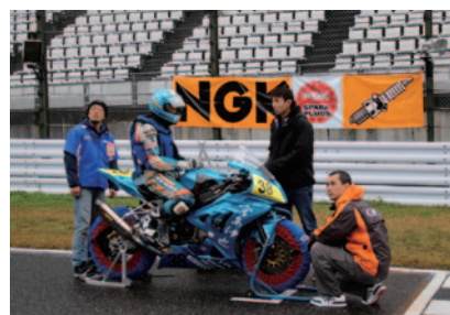
ポールポジション横のNGKスパークプラグ横断幕。ホームストレートには計3枚のNGKスパークプラグ横断幕が掲出されました。