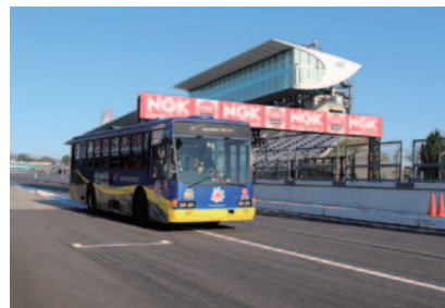
公式予選開始前に運行された下見バス(26日)。