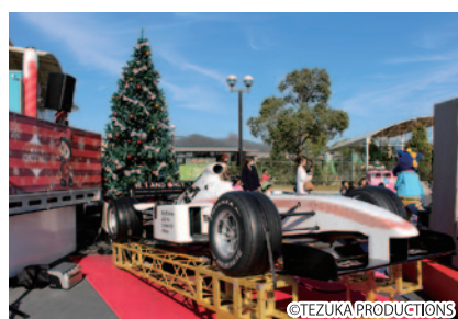
F1マシンをモチーフにしたウインターモニュメント「鈴鹿サーキット ファイアーリース」がゆうえんちモトピア内ブッチタウンストア前に登場。イベント時には左の巨大ろうそくに火がとります。