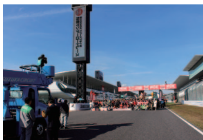
恒例の参加者・関係者による集合写真の撮影風景。高所作業車を用いての撮影はNGKスパークプラグ杯の風物詩となっています(26日)。