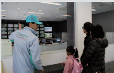
レース運営の中枢やふだん入れない場所をご案内する「バックヤードツアー」。ピット、パドック、コントロールタワー内の管制室(左)やメディアセンター、そして表彰台(右)などをご体験いただきました。