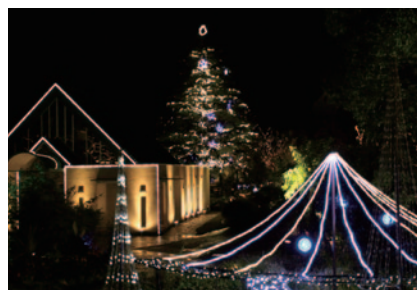
夜空を幻想的に照らす「ガーデンイルミネーション」がチャペルを中心としたホテルガーデンを美しく包み込み、お客さまの目を楽しませています。