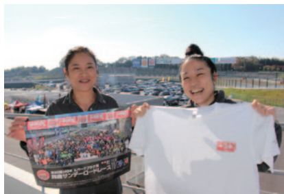
参加者全員に配布されたNGKスパークプラグロゴ入りTシャツと公式ポスター。Tシャツの袖には大会の日付が入っています。

半世紀以上もの長きにわたって冠スポンサーとして支えていただいている日本特殊陶業株式会社様。鈴鹿サーキットは、今年も鮮やかな赤色のNGKスパークプラグロゴに彩られ、ライダー達のシーズン締めくくりの大会を盛り上げました。