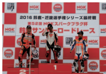
各クラス決勝上位3選手にはNGKスパークプラグキャップが贈呈されました(27日)。