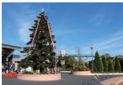
ゆうえんちモトピア内ウェルカム広場に登場したビッグなクリスマスツリー。