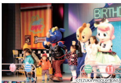
ゆうえんちモトピア内モビステージでは、11月にお誕生日を迎えたお友達をお祝いするイベント「コチラからみんなへ、ハッピーハッピーバースデー」が開催されました。