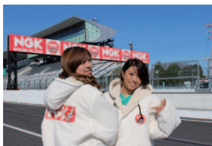
鈴鹿サーキットクイーンのお二人もNGKスパークプラグロゴ入りコスチュームを着用、進行や表彰式のお手伝いなど大会に華を添えました。