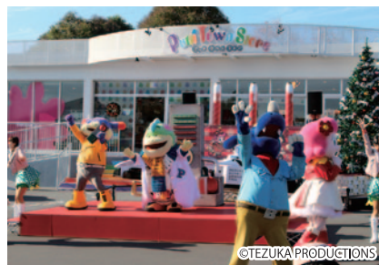
11月3日にお誕生日を迎えたコチラファミリーのブート。そのお誕生日会がゆうえんちモトピア内ブッチタウンストア前で行われました。