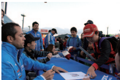
Rd.3レース後に行われた「キッズピットワーク」。中学生以下のお子さまと同伴者の方に無料で楽しみいただきました(12日)。