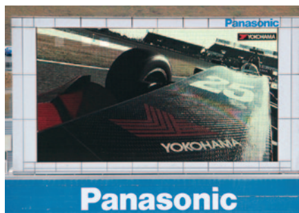
横浜ゴム株式会社