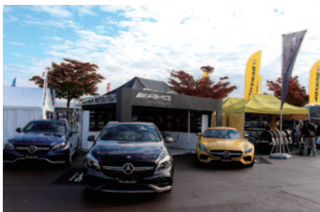
ニューモデルが展示されたメルセデス・ベンツブース。