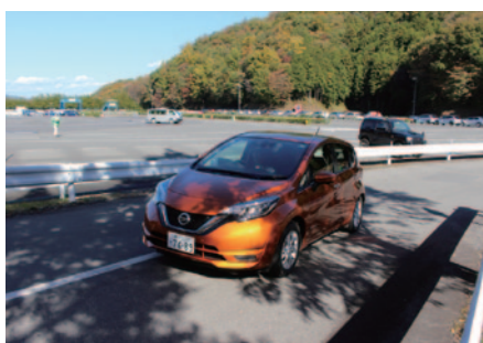
日産自動車株式会社