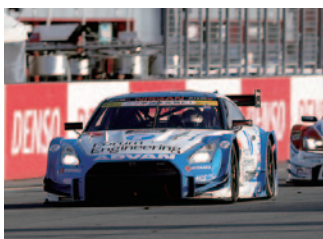
GT500 Rd.3ウイナー フォーラムエンジニアリング ADVAN GT-R

FIN…フィンランド GER…ドイツ ITA…イタリア NIR…北アイルランド NZL…ニュージーランド BS…ブリヂストン DL…ダンロップ YH…ヨコハマ