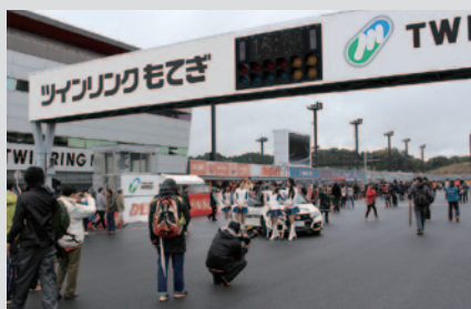
ロードコースのストレート部分を開放して行われた「メインストレートウォーク」。

今回は初の公式戦2レース開催となり、11日(金)が公式練習にあてられたため、ファンの皆さまにお楽しみいただけるイベントを展開いたしました。