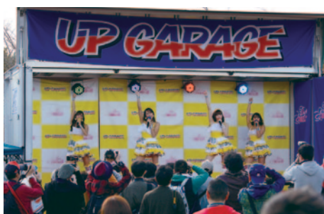
アップガレージブースで行われた「ドリフトエンジェルス」のミニライブ。