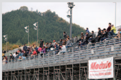
ビクトリースタンドを無料開放。ホームストレートにほど近いロケーションで公式練習をご観戦いただきました。