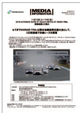
プレスリリース 7月1日(金)