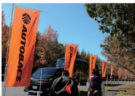
株式会社オートバックスセブン