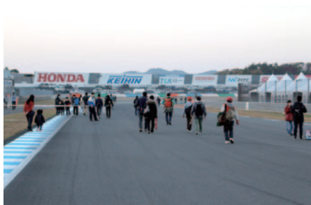
Rd.8決勝終了後、熱戦の余韻が残るコースを歩いてご体験いただきました(13日)。