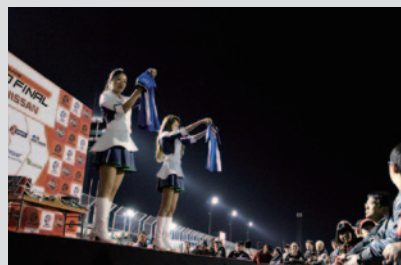
各チーム、監督、選手のご協力をいただき、熊本地震復興支援活動の一環としてチャリティオークションが行われました。