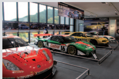
企画展「最速のNSXを目指して ～全日本GT選手権制覇への軌跡～」。Honda NSXの戦いがライバルマシンとともに紹介されています(12月12日(月)まで)。

PICK UP 3 Rd.3終了後、ホームストレート上の特設ステージでは「前夜祭」が開催されました。