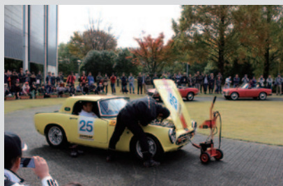
Honda S800(RSC/レース仕様車)のエンジン始動パフォーマンス。後方のHonda S500、S800のデモランも行われました。

PICK UP 2 Honda Collection Hallでは、大会期間中さまざまなイベントが開催されました。