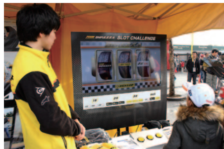
スロットゲームにチャレンジ、同一ブランドを3つそろえるとオリジナルグッズがプレゼントされたDUNLOPブース。