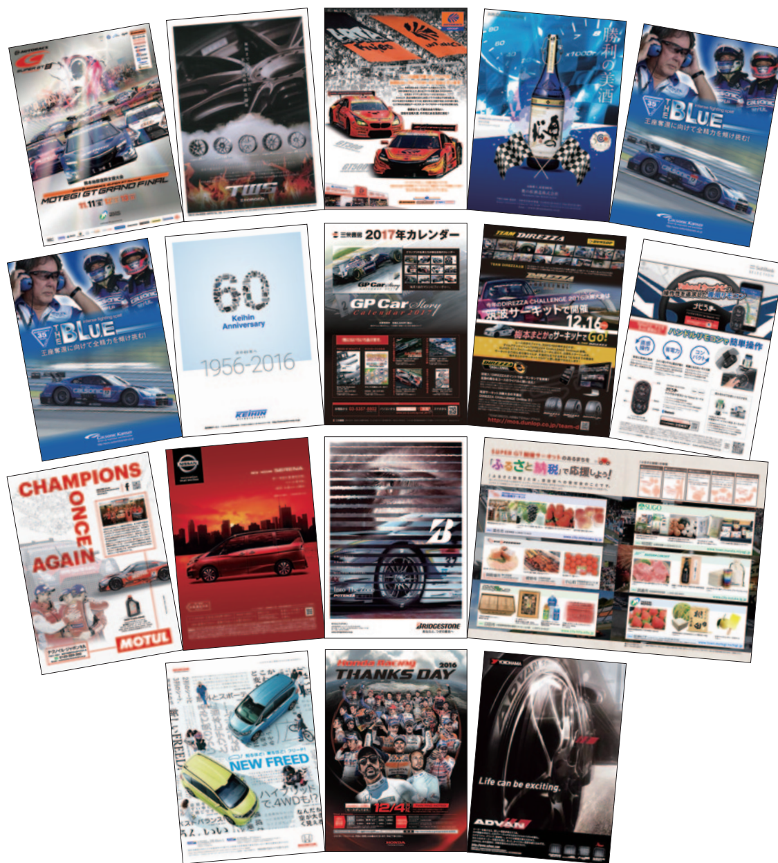
A4 カラー 84p 17,000部発行