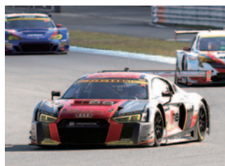
GT300 Rd.3 ウイナー Hitotsuyama Audi R8 LMS