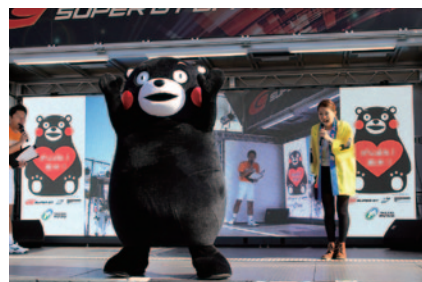
「熊本地震復興支援大会」として行われた今大会。ツインリンクもてぎにくまモンが登場。SUPER GTオフィシャルステージへの出演など大活躍しました。

PICK UP 2 Honda Collection Hallでは、大会期間中さまざまなイベントが開催されました。