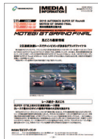
プレスリリース 10月28日(金)