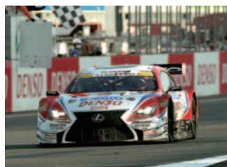
GT500 Rd.8ウイナー &チャンピオン DENSO KOBELCO SARD RC F