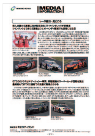
プレスリリース 7月22日(金)