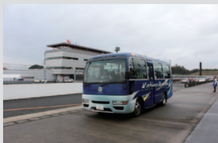
サービスロード(コースサイドの運営車両通路)をガイド付きのバスで走行しながらマシンの走りをご覧いただきました。