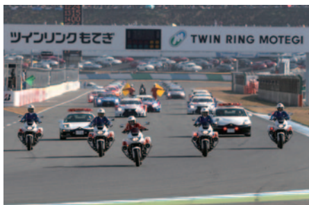
Rd.8決勝スタート前に栃木県警察が交通安全啓発活動の一環としてSUPER GTマシンを先導してのパレードを実施しました(13日)。