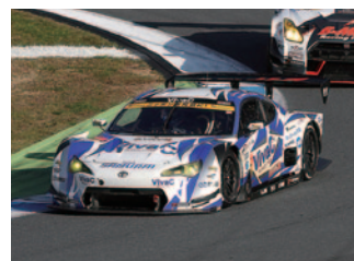
GT300 Rd.8 ウイナー &チャンピオン VivaC 86 MC

[サポートレース優勝者] FIA-F4選手権 第6戦 川井孝汰 第13戦 阪口晴南 第14戦 平木湧也 2016 Honda Sports & Eco Program CR-Z 10リッターチャレンジ 11.12もてぎ 藤吉健一