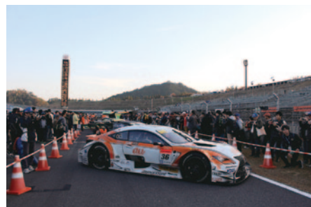
Rd.8決勝レースを終えたマシンの保管場所「パークフェルメ」の間近までお入りいただいた「パークフェルメウォーク」(13日)。