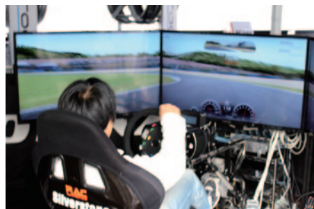
ドライビングシミュレーターによるタイムアタック大会が行われたBRIDGESTONEブース。