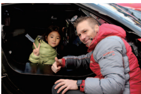
2013年仕様のGT500マシンコックピット体験が行われたNISSANブース。子どもたちの乗降をアシストするのはミハエル・フルム選手。