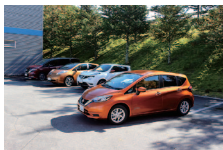
ツインリンクもてぎ周辺の公道を利用した「乗って体感!技術の日産試乗会」。