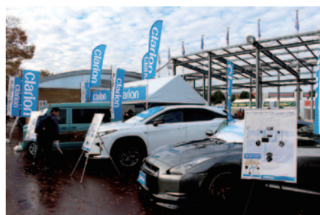
音源からスピーカーまで完全デジタル再生。車載用フルデジタルサウンドシステムの試聴体験が実施されたクラリオンブース。