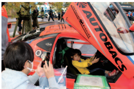
ARTAガライヤの Cockpit体験「キッズライド」が行われたオートバックスブース。