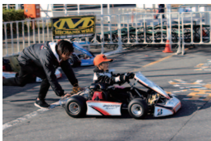
中央エントランスで行われた「キッズカート教室」。