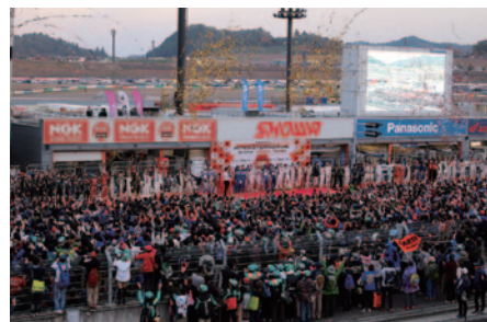
Rd.8表彰式に続いてホームストレート特設ステージで行われた「グランドフィナーレ」。全ドライバーが登場して、ファンに一年の感謝の気持ちを伝えました(13日)。