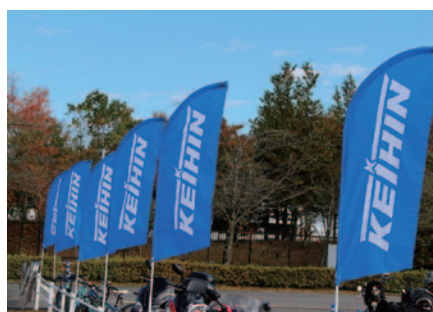
株式会社ケーヒン