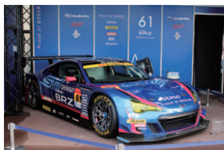
GT300仕様BRZが展示されたSUBARUブース。