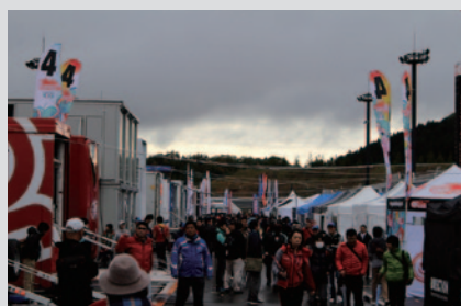
パドックを無料開放。多くのファンの皆さままでにご覧いただきました。