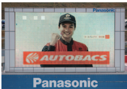
株式会社オートバックスセブン