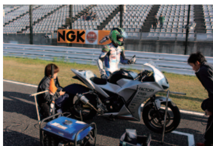
ポールポジションの真横に掲出されたNGK横断幕。