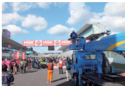
恒例の参加者・関係者による集合写真の撮影風景。クレーンを使っののりがかりな作業です。