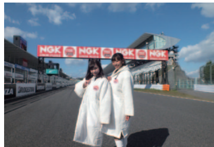
鈴鹿サーキットクイーンもNGKロゴ入りコスチュームを着用し、進行や表彰式のお手伝いなど大会に華を添えました。