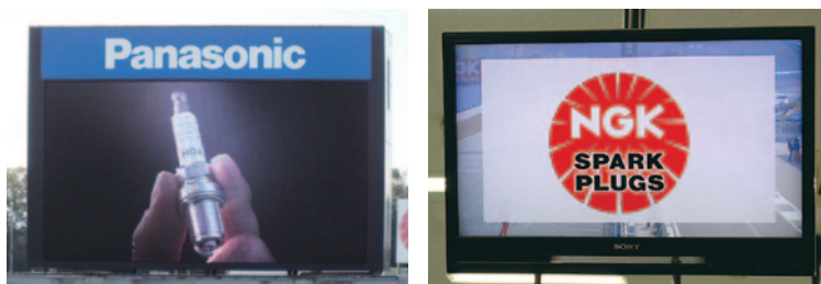
日本特殊陶業株式会社