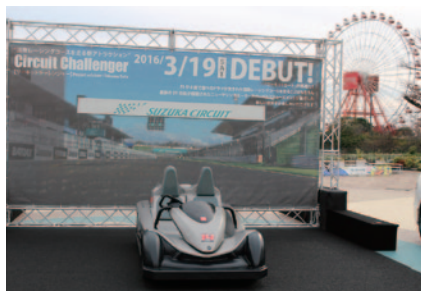
2016年3月19日にデビューする新感覚EVアトラクション「サーキットチャレンジャー」がウェルカムひろばに展示され、注目を集めていました。