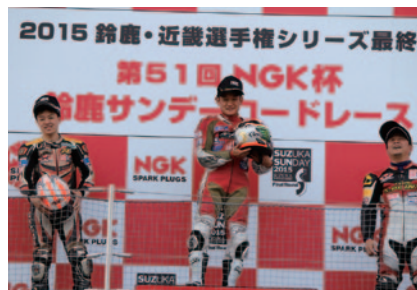
各クラス上位3選手にはNGKキャップが贈呈されました。