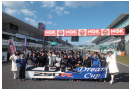
〔CBR250R Dream Cup DUNLOP杯 Grand Championship〕参加者の皆さんによる集合写真。