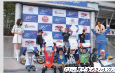
グランドスタンド手前のGPスクエアでは、ペダルなしランニングバイク「ストライダー」によるレース「STRIDER-1 SUZUKA GP」が5周年記念イベントとして華やかに開催され、1,000人ものキッズ達がさまざまな競技にチャレンジしました。