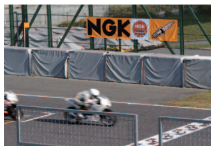
コントロールライン付近に掲出されたNGK横断幕。