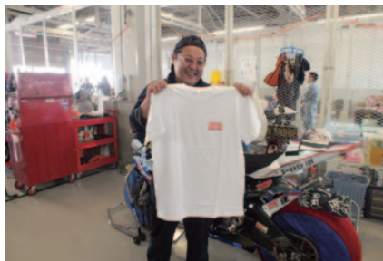
参加者全員に配布されたNGKロゴ入りTシャツ。

半世紀以上もの長きにわたって冠スポンサーとして支えていただいている日本特殊陶業株式会社様。今年も鮮やかな赤色のNGKロゴが晩秋の鈴鹿サーキットを飾り、ライダー達へのエールとなりました。