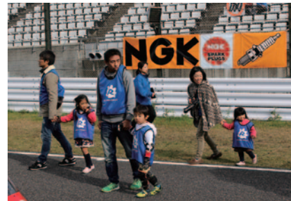
〔STRIDER-1 SUZUKA GP〕(後述)参加者の中から抽選でお楽しみいただいたグリッドウォーク体験。