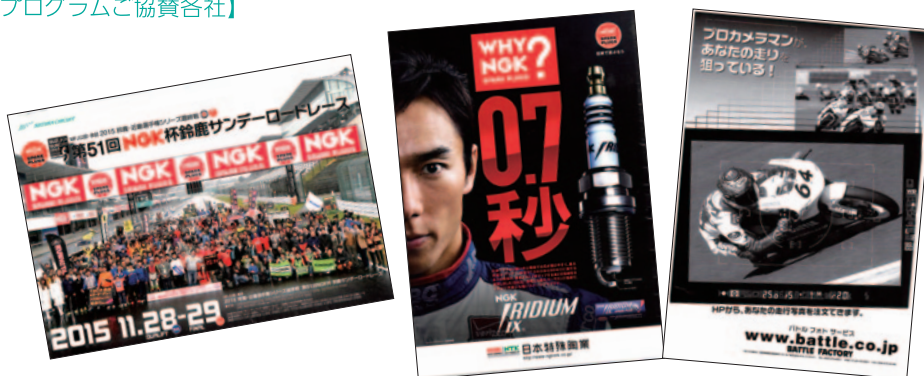
A4 カラー /モノクロ 22p