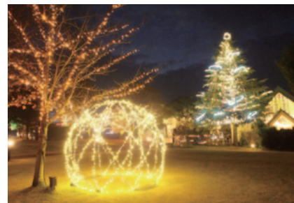
ホテルエリア(写真)、モトピアエリアではクリスマスモードいっぱいのファンタジックなイルミネーションがお客さまの目を楽しませています。