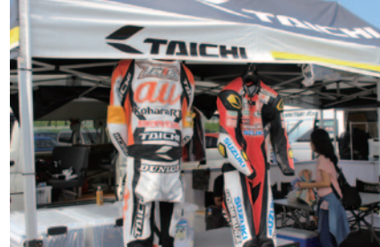
アールエステイチのパドックサービスブース。