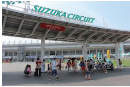
今大会はゆうえんち入園料でご観戦いただけるため、多くのファミリーがレーシングコースエリアを訪れました。