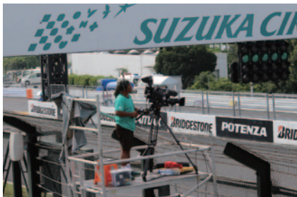
大会の様子はアジア各国に生中継されました。