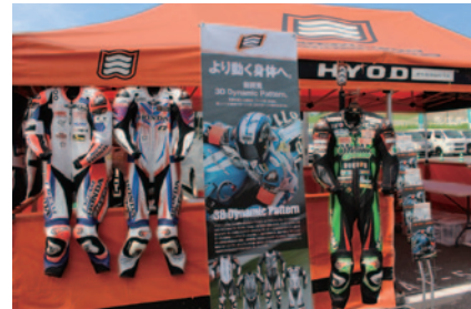
HYODのパドックサービスブース。