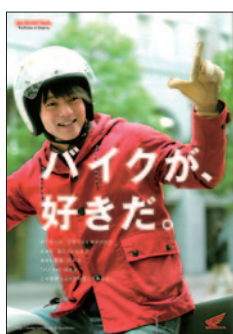
住友ゴム工業株式会社 株式会社ホンダモーターサイクルジャパン