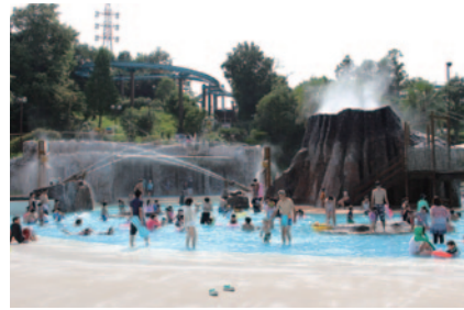
大会期間中は「みんなの冒険プール」[アクア・アドベンチャー]を特別営業、残暑厳しい中、多くの歓声であふれていました。