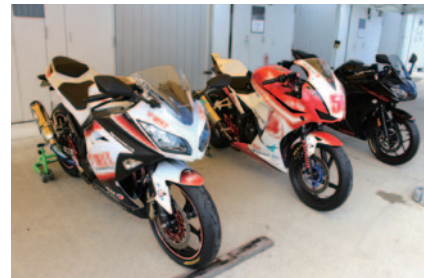
2015年よりアジアロードレース選手で開催される250ccクラスのマシンが発表され、パドックに展示されました。