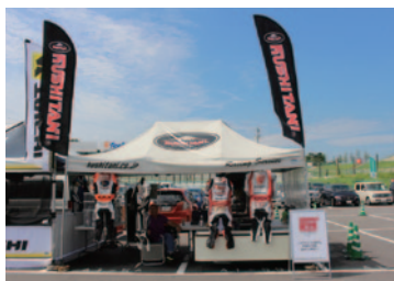
株式会社クスタニ