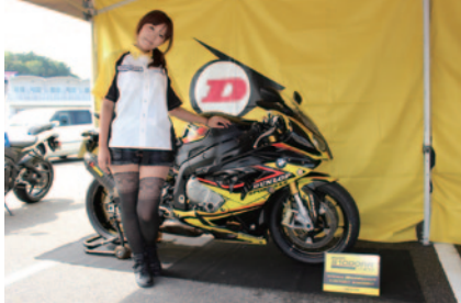
ダンロップタイヤ装着バイクのほか同社製品を展示・PRしたダンロップブース(パドック)。