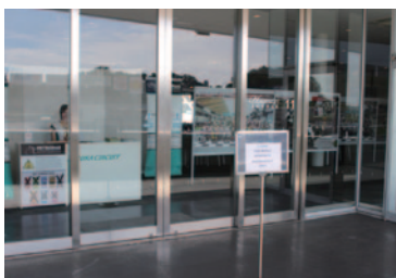
TWO WHEELS MOTOR RACING