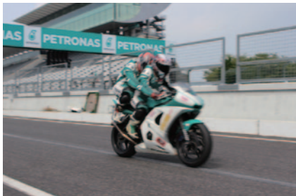
PETRONASがゲストを対象に行ったレーシングコースタンデムラン[Pillion Ride]。