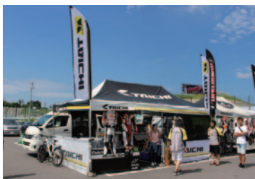
株式会社アールエスタイチ