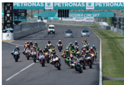
SS600レース1スタートシーン