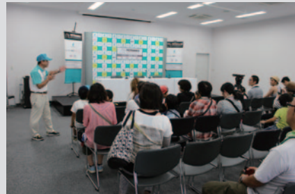
ビットビル2Fの記者会見場。