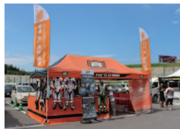
株式会社ヒョウドウプロダクツ