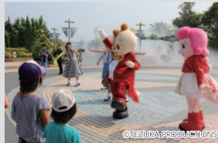
コチラのお誕生日(9月23日)を歌やダンスでお祝いする「コチラ35thアニバーサリーハロータイム!」(ジョイフル広場)。