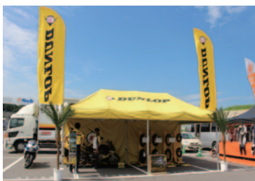
住友ゴム工業株式会社