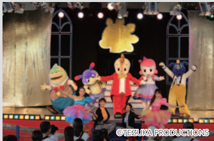
コチラ35thを記念した特別なショー「コチラ35thアニバーサリーショー」(モビステージ)。

鈴鹿サーキットのマスコットキャラクター コチラの35thアニバーサリーとして、楽しいイベントが多数開催されています(11月3日<月・祝>まで)。