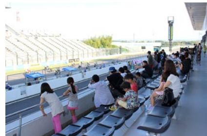
ピットビル2Fホスピタリティブースの一部を無料開放、お客さまに快適な室内観戦と迫力のテラス席(写真)をお楽しみいただきました。