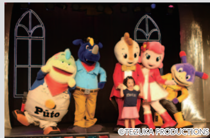
コチラファミリーと一緒に写真が撮れる「ブッチキッズと はい、ポーズ」(モビステージ)。