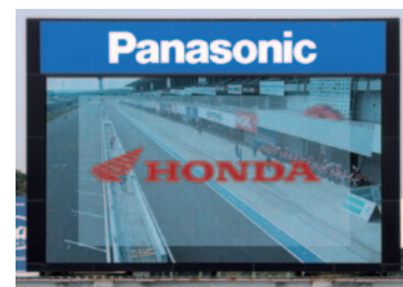
株式会社ホンダモーターサイクルジャパン