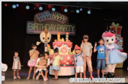
9月生まれのお友だちをコチラファミリーが楽しくお祝いする「コチラからみんなへ ハッピーハッピーバースディパーティ」(モビステージ)。