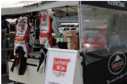
クシタニのパドックサービスブース。