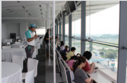
グランドスタンド最上段のVIPスイート。

ふだんは見られない国際レーシングコースの“ウラ側”をご観いただける「バックヤードツアー」。多くのファミリーにご体験いただきました。