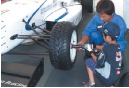
本物のフォーミュラカーのタイヤ交換にチャレンジ!

GPスクエアに設置されたコチラレーシングブースを拠点に、子どもたちにモータースポーツに触れてもらうイベントを実施しました。