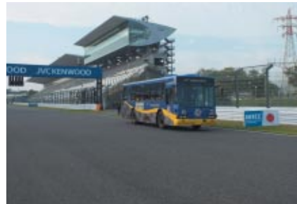
WTCCレース2の優勝者を的中させた方を対象とした国際レーシングコースバスツアー(22日)。