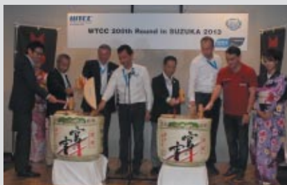
関係者一同による鏡割りと振る舞い酒

9月21日(土)夜、ビットビル2Fホスピタリティラウンジで横浜ゴム様主催のウェルカムパーティーが開催されました。