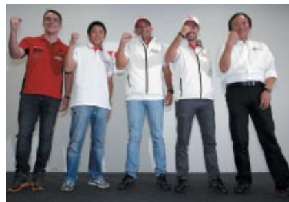
20(金)に報道関係者を対象に行われた「Honda Civic WTCC参戦記者会見」。