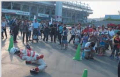
アバットのレーシングスーツに身を包んだパフォーマンスが見事なロボットダンスを披露。