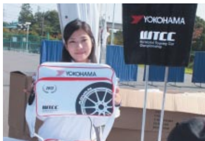
WTCC開催を記念して、ヨコハマグッズが入った恒例のオリジナルバッグが限定発売されました。