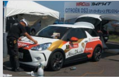
ステッカーチューン実演。