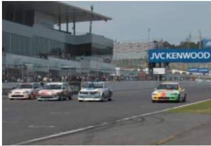
国内外のツーリングカーレースで活躍してきたHondaシビック。歴代のマシンがデモランを実施しました(22日)。