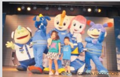
コチラちゃんファミリーと記念撮影「フッチキッズと はい、ポーズ」。