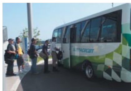
「激感エリア」を短時間で移動できる無料バス「パドックシャトル @激感」。