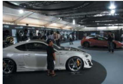
ショールームさながらのPRブース内部。タイヤやホイール、そして同社製品を装着した車両が展示されました。