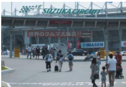
今大会はGPスクエアまではゆうえんち入園料で入場可。各社様PRブースや「ユーロカーズミーティング」などをより多くの皆さまにお楽しみいただきました。