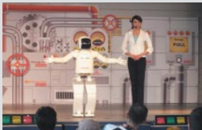
Hondaが開発した二足歩行ロボット「ASIMO」のパフォーマンスライブ。

秋の週末家族連れでにぎわうゆうえんち内「モビステージ」でも楽しいイベントが行われました。