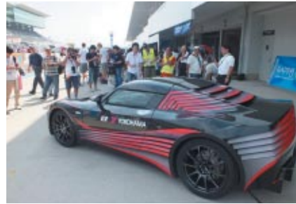
横浜オリジナルEV「AERO-Y」。PRブースやビットウオーク(写真)での展示で注目を集め、さらにはデモランでその高いパフォーマンスを披露しました。