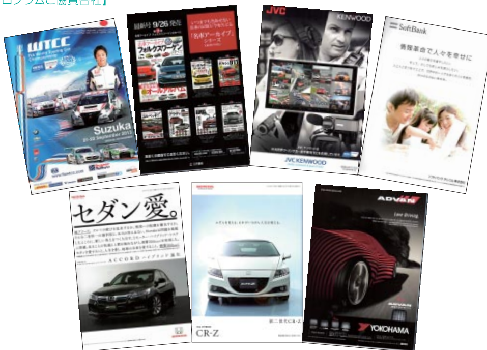
A4 カラー 76p 25,000部発行