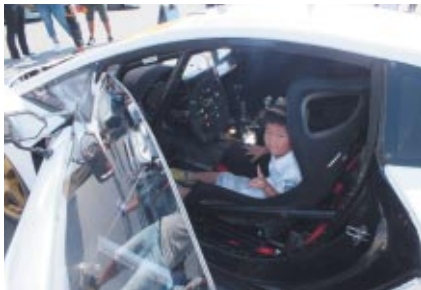
ランボルギーニのレーシングマシンコックピット体験(コチラちゃんファンクラブ、コチラレーシングファンクラブ会員限定)。