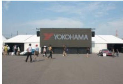
GPスクエアに設置されたPRブース。中央の大型ビジョンではさまざまなCFやPVを放映。両サイドに展示されたオリジナルEVやヒルクライム用EVが目をひきました。

WTCCとスーパー耐久のワンメイクタイヤサプライヤーである横浜ゴム様には、今回も場内各所で多彩なプロモーション展開を実施いただきました。