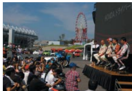
Hondaドライバー4名が一堂に会してのトークショーには大勢のファンが詰めかけました(21日)。