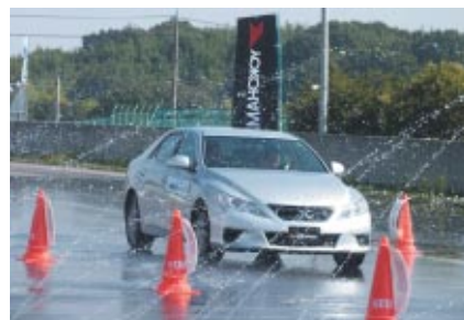
最高のウェットグレード「a」を獲得したBluEarth-Aのウェット路面での性能をお客さまにSTEC(鈴鹿サーキット交通教育センター)でご体感いただきました。