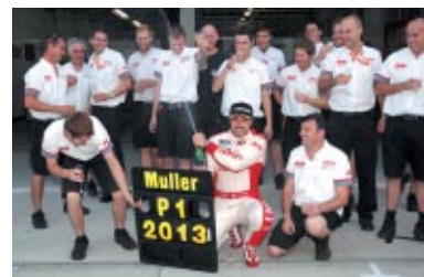
Y.ミュラーが4度目のドライバーズチャンピオンに