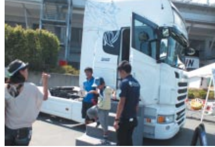
レーシングマシンを運ぶ大きなトラック「スカニアTopline」の運転席を体験。