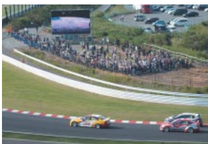
「格闘技レース」とも称されるWTCCの迫力を目前で楽しんでいただくとう東コースに3カ所設置された「激感エリア」(パドック入場バスをお持ちの方対象)。