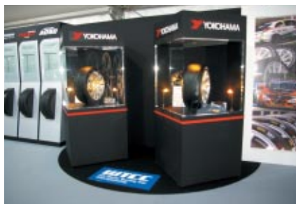
PRブース内にはWTCCで実際に使用されるドライ&ウェットタイヤが展示され、注目を集めていました。