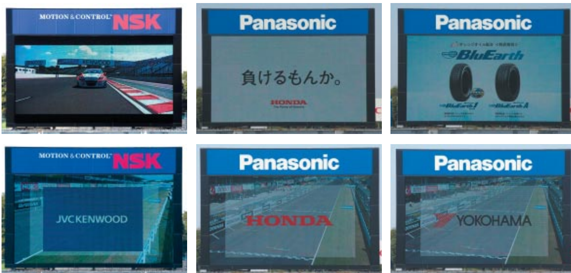
株式会社JVCケンウッド 本田技研工業株式会社 横浜ゴム株式会社