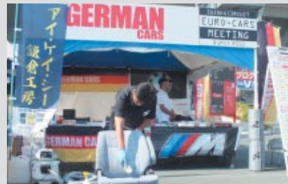
シート洗浄の実演パフォーマンス。