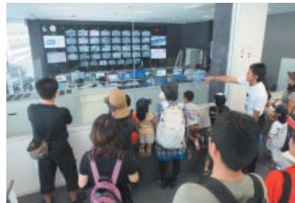
レース運営の中枢をガイド付きでお楽しみいただいた「バックヤードツアー」(コチラちゃんファンクラブ、コチラレーシングファンクラブ会員限定)。