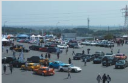
会場にせいぞろいした新車・旧車・カスタムカー。

GPスクエアに約100台のヨーロッパ車が集合した「SUZUKAユーロカーズ ミーティング」。クルマ雑誌「eS4」「GERMAN CARS」「Tipe」「WRC PLUS」「プレイドライブ」各誌とのタイアップで華やかな各種イベントが展開されました。