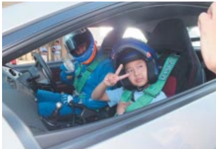
マーシャルカー同乗体験走行(21日 コチラレーシングファンクラブ会員限定)。