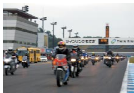
全レース終了後にロードコースを体験走行いただいた「ファイナーレパレード」