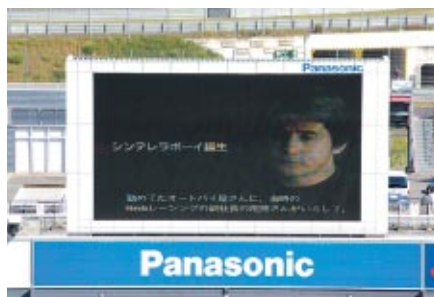
過去の貴重な映像を織り込んだインタビューがサーキットビジョンでオンエアされました