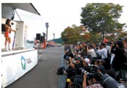
グランドスタンドプラザで行われた「キャンペーンギャルオンステージ」