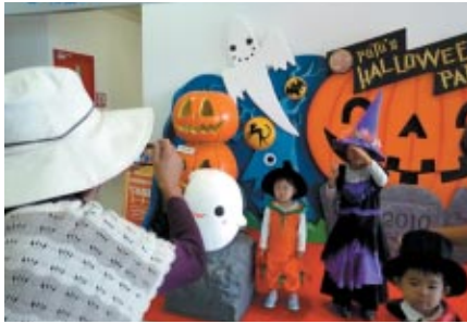
ツインリンクもてぎでは「プートのハロウィンパーティー」を10月31日(日)まで開催中 写真のフォトコーナーなど楽しさ満載です。