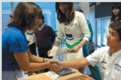
サイン会でファン一人ひとりと交流

決勝レース終了後には事前にお申込みいただいたファンの皆さんと「グランツーリスモカフェ」で懇親会を行いました。当日の優勝で「祝勝会」にもなり、大いに盛り上がりました。