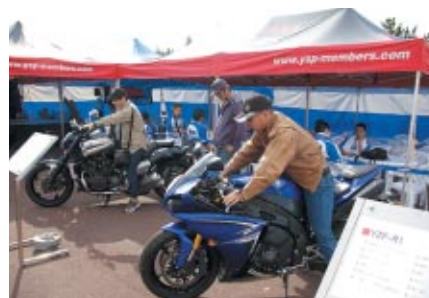
ニューモデル搭乗体験が行われたヤマハブース