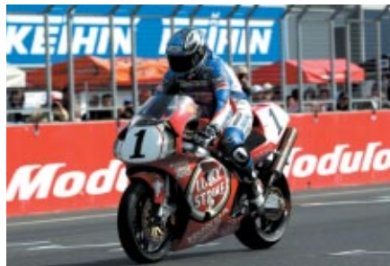
1999年モデルのHonda RVF/RC45を駆って行われた「メモリアルラン」(17日)