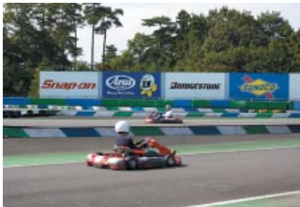
「カートランド」では伊藤選手の設定したタイムに チャレンジいただきました サイン入り色紙がプレゼントされました