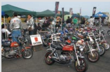
メイン会場の南コースに集まったカスタムミニバイク

4サイクルミニバイクの祭典「4 MINI/パラダイスEAST」が開催されました。(17日 主催:「モトチャンプ」誌)