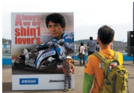
ファンの想いを代弁したパネル(グランドスタンドプラザ)は多くのお客様のフォトスポットとして人気でした