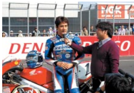
「メモリアルラン」終了後のインタビュー