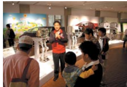
Honda Collection HallではASIMO生誕10周年を記念して その歴史を紹介するガイドツアーが行われました