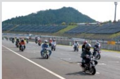
JSB1000クラス決勝直前のロードコースをパレード