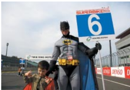
グリッドキッズの「バットマンお父さん」 6番グリッドながらポールポジション並みに目立っていました