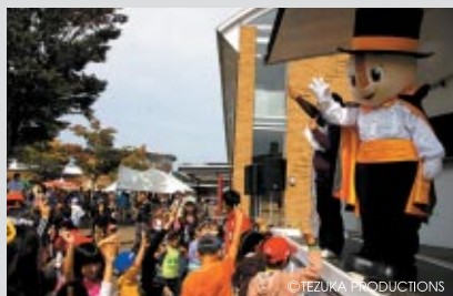
選考はコチラとの楽しいジャンケン大会で

ご観戦にお越しのお子さまと保護者の方に JSB1000クラス予選上位6台のグリッドキッズを務めていただきました。