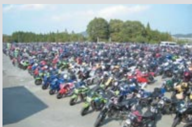
Honda Collection Hall前のP8に設けられたバイク専用駐車場バイクでのご来場者は2日間合計で1,500台でしたツーリングアワード参加者は昨年より100名多く、650名の方にご参加いただきました

千葉テレビ制作バイク番組「週刊バイクTV」とツインリンクもてぎがコラボレーション、バイクでご来場のお客さまを対象としたイベントを多彩に開催しました。