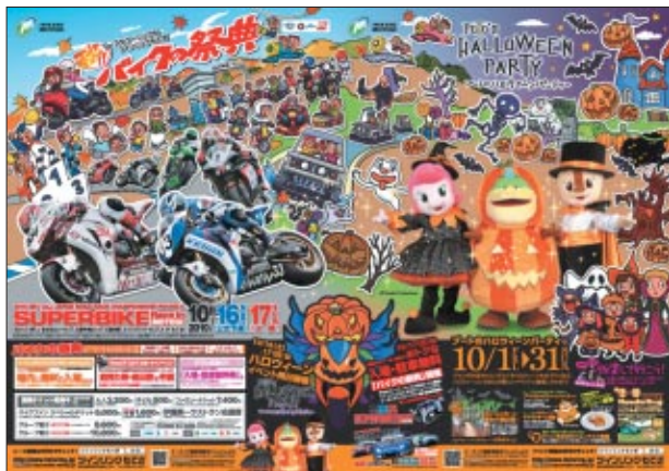
公式B2ポスター (「ブートのハロウィーンパーティー」B2ポスターと連貼した状態です)