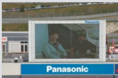
JSB1000クラス場内実況放送のスペシャル解説を行っていただきました