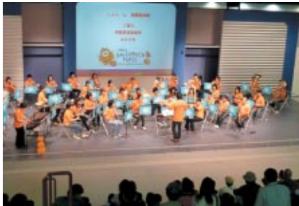
「宇都宮音楽集団」による演奏や指揮者体験を お楽しみいただきました(17日 ファンファンラボ)