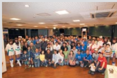
最後に全員で記念撮影