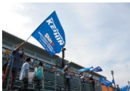
グランドスタンドB席に設置された応援席にはフラッグや横断幕が