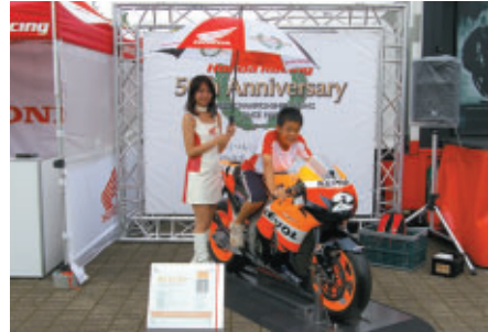
二輪レースの最高峰MotoGPマシン、RC212Vの搭乗体験