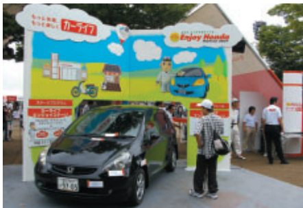
ユーザーの楽しく快適なカーライフに役立つ情報を紹介する「カーライフブース」