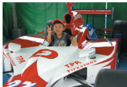
9月19日に決勝が行われる 「ブリヂストン インディジャパン300マイル」PRブースでの コックピット体験