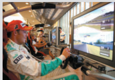
祝賀会ではロッテラー選手とサポーター代表が グランツーリスモで対決!