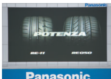
株式会社ブリヂストン