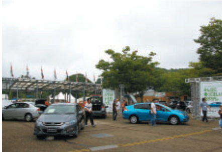
四輪・二輪のHondaニューモデルが多数展示されました

ツインリンクもてぎ場内一円では「Enjoy Honda MOTEGI 2009」が華やかに開催されました。