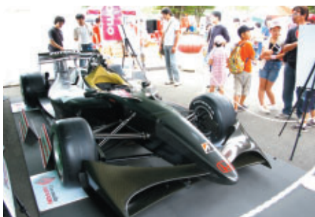
新車シャシー「FN09」が展示され、注目を集めていました