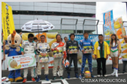
往年の名選手らによるフォーミュラバトル「いばらきメロンカップ」「コチラレーシングドリームマッチ」

PICK UP 1 今回は「茨城県感謝デー」として、特産のいばらきメロンをさまざまな場面でPRいただきました。(協賛:JAかしまなだ、いばらきメロンPR推進協議会)