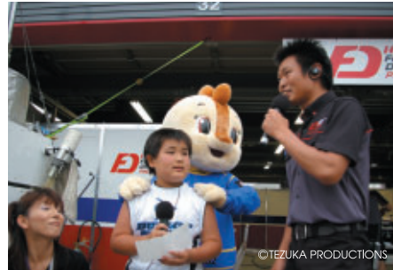
「コチラレーシングのKIDSピットウォーク」で行われた「KIDSレポーターになろう!」