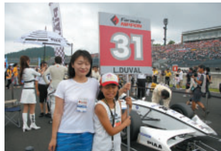
とちぎテレビを通じてご応募いただいた栃木県在住の親子の皆さんがグリッドキッズをつとめました