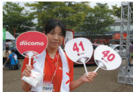
お客さまに無料配布されたドコモうちわ