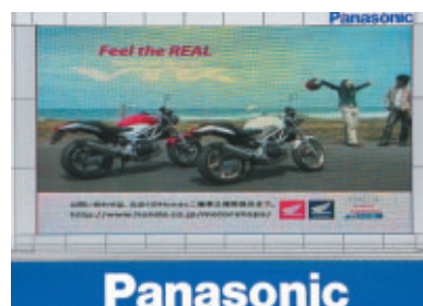
株式会社ホンダモーターサイクルジャパン