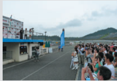
優勝チームサポーターは表彰台（ポルティウム）の真下から ウィナーへの祝福をお贈りいただきました