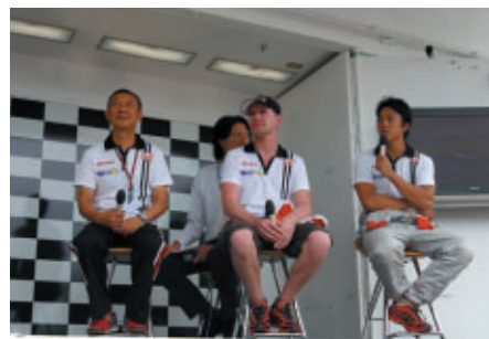
9日(日)のドライバートークショーには DOCOMO TEAM DANDELIONの監督と両選手が登場