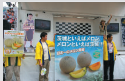
グランドスタンドプラザ特設ステージではじゃんけん大会でお客さまにいばらきメロンをプレゼント