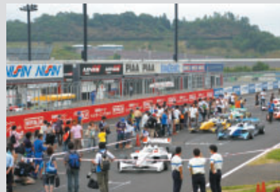
チームサポーターズシートご利用のお客さま全員に お楽しみいただいた「アフターチェッカーコースウォーク」