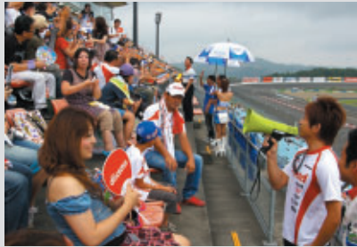
決勝スタート前に選手がシートを訪問 サポーターへのメッセージを伝えました

おなじみのチーム別応援席「チームサポーターズシート」 今回もサポーターの皆さんの熱い声援で大会を盛り上げていただきました