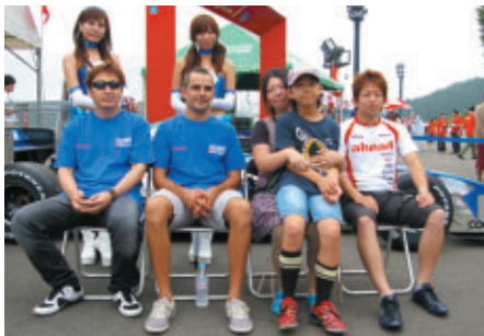
ローソングッズをお買い上げの方を対象に行われた IMPULドライバーとの記念写真