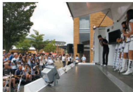
各チームのキャンペーンギャルが勢ぞろいした 「キャンペーンギャルオンステージ」