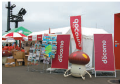
株式会社エヌ・ティ・ティ・ドコモ【PR】 株式会社ディップス【販売】