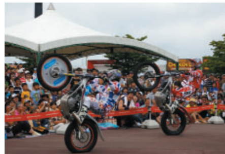
驚異のバランステクニックをお楽しみいただいた「Honda トライアルバイクショー」