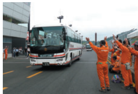
レース終了直後のロードコースをバスで体験走行いただきました