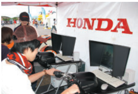
ライディングシミュレーターで安全なテクニックを模擬体験しながら習得