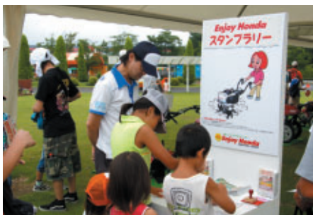
イベント会場を回ってグッズをゲットできる「スタンプラリー」