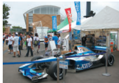
株式会社KARZ【販売】 株式会社ローソン【PR】