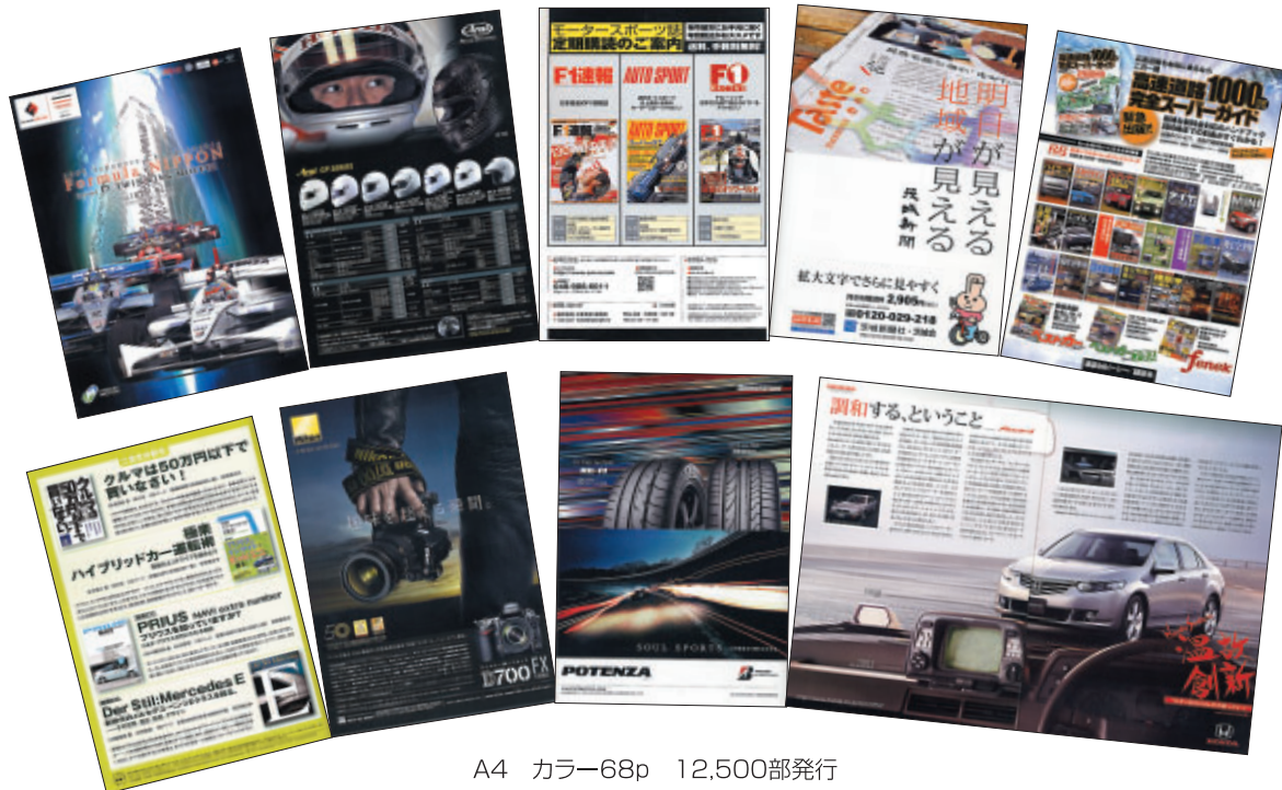
A4 カラー68p 12,500部発行