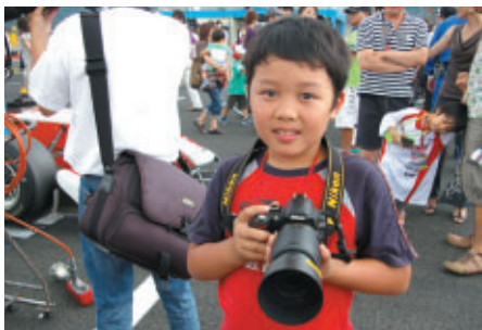
ニコン デジタル一眼レフカメラでグリッドなどでの撮影をご体験いただいた「ニコン サーキットフォトグラファープログラム」