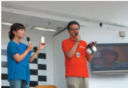
とちぎテレビ presents スペシャルステージ DOCOMO TEAM DANDELION で使用されている DOCOMO の通信デバイスの秘密をご披露いただきました