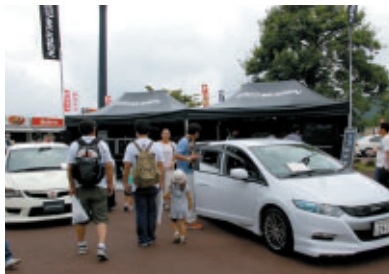
株式会社M-TEC【販売】 株式会社プロ・フィット スポーツینگ【販売】