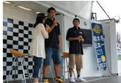
地元FM局 Radio Berry presents FUN TIME スペシャルステージ プロバスケットチーム「リンク栃木郡ブレックス」の選手が出演