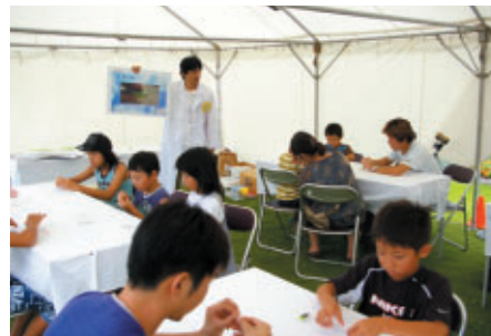
かわいい虫型ソーラーバッテリーを作ってみよう! 「太陽電池工作教室」