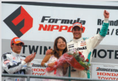
優勝チームサポーターの中から抽選で選ばれた方に 花束贈呈と表彰台登壇の体験がプレゼントされました