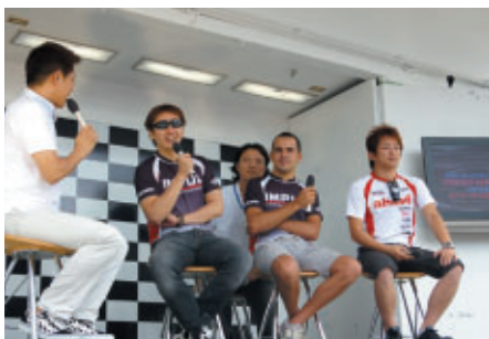
グランドスタンドプラザ特設ステージで行われた 「ドライバートークショー」8日(土)にはIMPULの3選手が登場