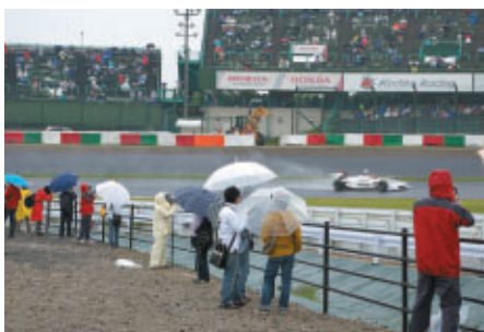
パドック入場のお客様を対象としたコースサイド観戦ポイント 「激感エリア」