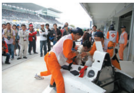
ピットウォーク時に行われたレスキューオフィシャルの皆さんによる レスキューデモンストレーション