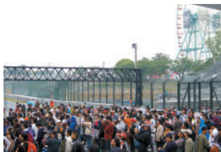
フォーミュラ・ニッポンの表彰式はコースを開放してご覧いただきました