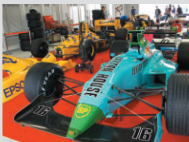
走行時以外にはピット内で展示され、 多くのファンを楽しませました