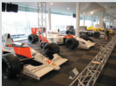
F1からツーリングカーまでラインナップされた 4輪コーナー

ピット2Fホスピタリティラウンジで開催された特別展示「鈴鹿サーキット コレクションホール」。 鈴鹿を走った往年のマシンが一堂に 集められ、ホスピタリティラウンジ、ホ スピタリティテラス、VIPスイートで利 用のお客さまに公開されました。