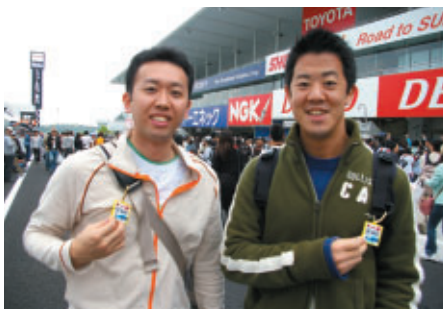
香川と兵庫からお越しのお客さま 「高速も安くなったし、新名神もできたので来やすくなりました 新グランドスタンドは今日みたいな天候の時はおうれしいです」