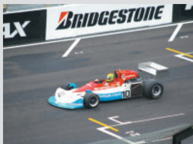
ロニー・ピーターソンが駆ったマーチ761(76)の雄姿

鈴鹿でのF1日本GP再開を記念して往年のF1マシンのデモ走行と展示が行われました。 マシン：マーチ761、ロータス101(2台)、レイトンハウス911、ロータス77(展示のみ)