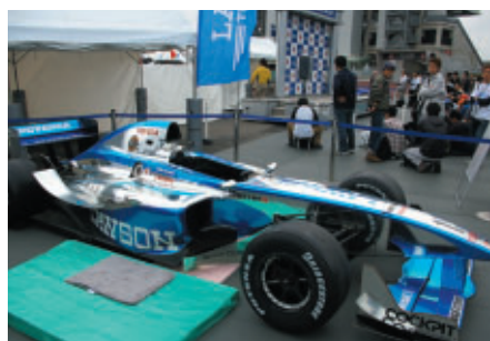
GPスクエアのローソングブースに展示された2008チャンピオンマシン ローソンググッズお買い上げの方対象に搭乗体験も実施されました