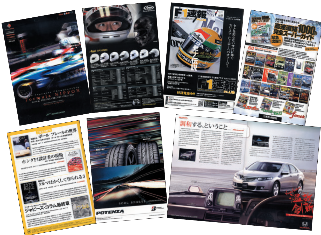
A4 カラー56p 12,500部発行