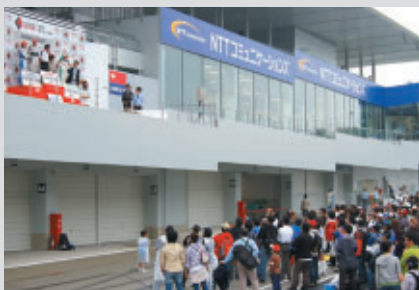
上位3チームのサポーターの方にはボーディアム(表彰台)の 真下までご入場いただきました