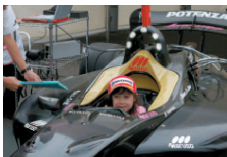
GPスクエアのフォーミュラ・ニッポンブースでは 新型マシンFN09の展示と搭乗体験が人気を呼んでいました