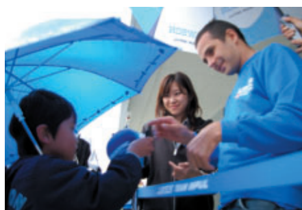
中学生以下のお子さまと保護者の方に無料で楽しんでもらった 「キッズウォーク」