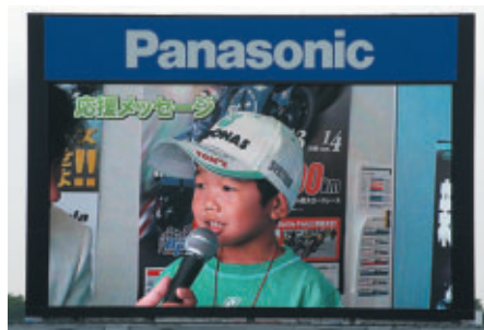
「ファミ得チケット」ご購入のお客さまの中から抽選で放送室から ファンの選手に応援メッセージを送っていただきました