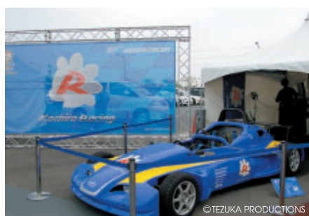
コチラレーシングブースでは同ファンクラブに入会された方に 先着でグリッドキッズ体験やモータースポーツ記者体験をプレゼント