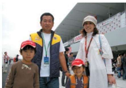
愛知県岡崎市からお越しのお客さま 「家族でTeam LeMansを応援しています」