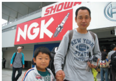
奈良からお越しのお客さま 「近いので鈴鹿にはよく来てます!」