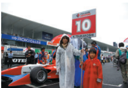
コチラレーシングファンクラブご入会のお客さまに グリッドキッズをつとめていただきました