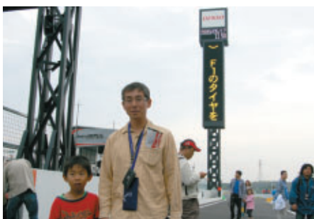
愛知県東海市からお越しのお客さま 「伊勢湾岸自動車道のおかげで鈴鹿がすごく身近になりました」