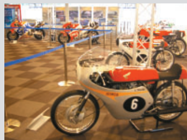
世界GPや8耐で活躍した2輪マシンのコーナー