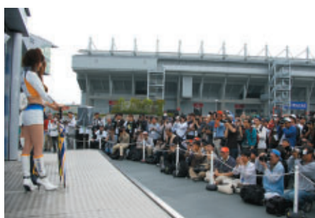
GPスクエア(写真)、ホスピタリティテラスで行われた 「レースクイーンフォトセッション」