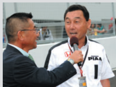
中嶋悟氏も自らが乗ったマシンを前に感無量の面持ち