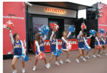
マシン展示やSUPER GTコックピット体験など数々のイベントが 展開されたINDY Honda Village これはPRブースでのBREXYによるチアリーディング