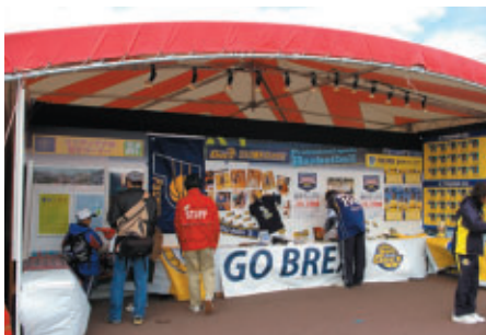
栃木のプロスポーツ2チーム(リンク栃木ブレックス、栃木SC)とインディアナ州のコラボブース