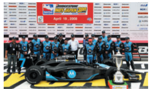
新たな歴史がツインリンクもてぎで誕生