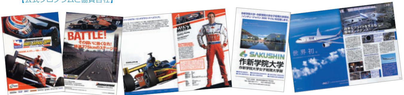
A4 カラー140 p 40,000部発行

株式会社アライヘルメット アルパイン株式会社 Indy Racing League Indianapolis Motor Speedway 株式会社イデア 株式会社オートバックスセブン GAORA 作新学院・作新学院大学女子短期大学部 株式会社三推社 スタンレー電気株式会社