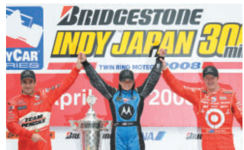
優勝したダニカ・パトリック