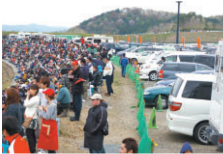
愛車を降りたらすぐそこが観戦席 大好評のコースサイドパーキング