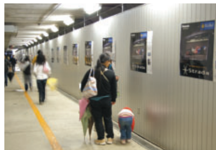
グランドスタンドからパドックへの地下通路で展開されたPanasonicポスター掲出