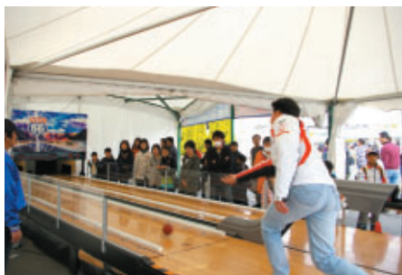
ミニボウリングが大人気の日本ボウリング場協会ブース