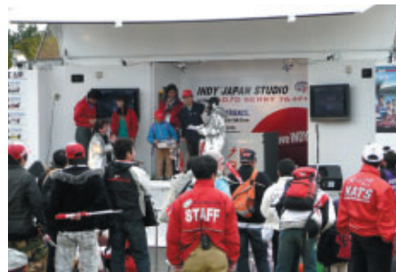
HondaStyleによるステージイベントも実施されました