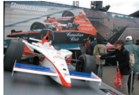
デモマシンや商品展示が多彩に展開されたブリヂストンブース