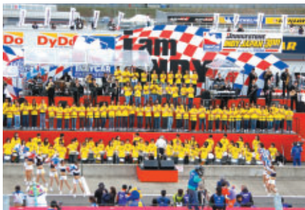
栃木県出身の世界的ジャズプレイヤー渡辺貞夫さんを中心に 米海軍第7艦隊音楽隊や日本の子供たちがコラボレートしての スペシャルセッション(19日)