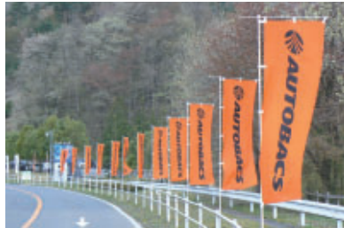
株式会社オートバックスセブン