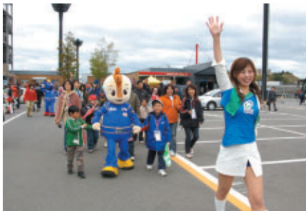
抽選で選ばれたご家族がツインリンクもてぎエンジェルや コチラレーシングの案内でパドック探検!