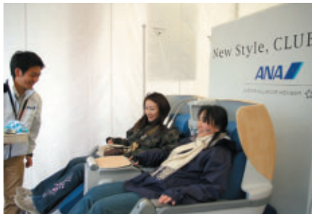
国際線の本物のビジネスシートが体験できるANAブース 輪投げゲームも好評でした