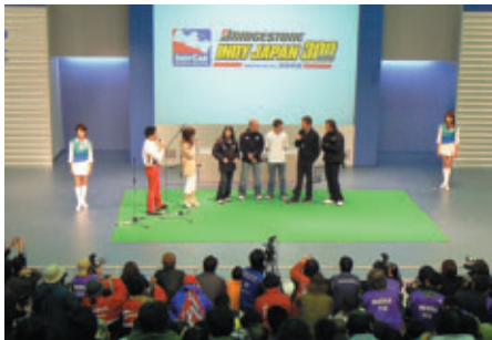
18日(金)の走行キャンセルを受けて急きょ開催された ドライバートークショー フレンドリーでユーモアあふれる選手の 受け答えに会場はおおいにわきました