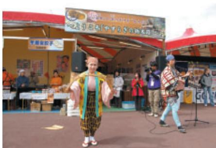
栃木県観光PRブースでは 「南京玉すだれ」の実演が歓声を集めました