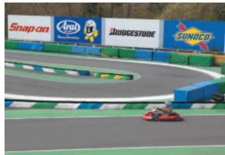
武藤選手が指定するターゲットタイムにカートでチャレンジ!