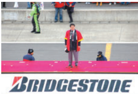
栃木県副知事 須藤揮一郎様による 「Lady and Gentlemen, Start your Engines」