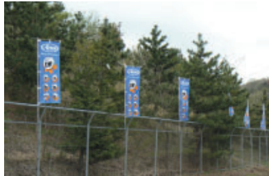
株式会社アライヘルメット