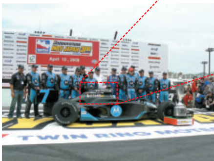
優勝したダニカ・パトリックのマシンには Honda Cars茨城のロゴが!

8台のマシンに各社のロゴを掲出し、応援席を設置していただきました。 また、事前に専用ポスターを作成し、Indy Japanの盛り上げにも一役かっただきました。