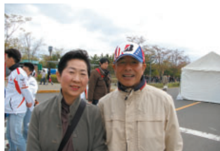
栃木県内からお越しのご夫婦 決勝スタートの前に初めてのレース観戦に期待いっぱいとのこと