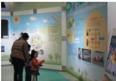
ブラジル国管石油会社 ペトロプラス社協力による、エコエネルギー「エタノール」紹介コーナー(ファンファンラボ)