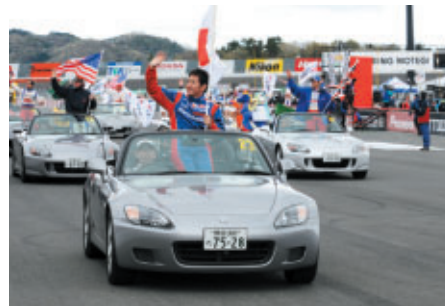
全ドライバーがHonda S2000でパレード(19日)