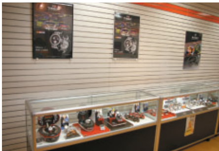
ダニカ・パトリックがアンバサダーを務めるTISSOT(ティン)のコレクション「モータースポーツフェア」がミュージアムショップ(写真)とホビーショップROBINで行われました