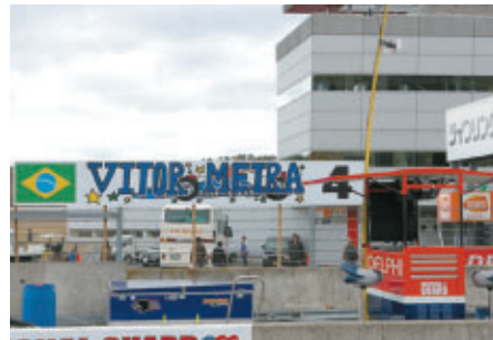
ピット後ろのドライバー名看板は地元の子供の墨文字や 各学校の共同デザインによるものです