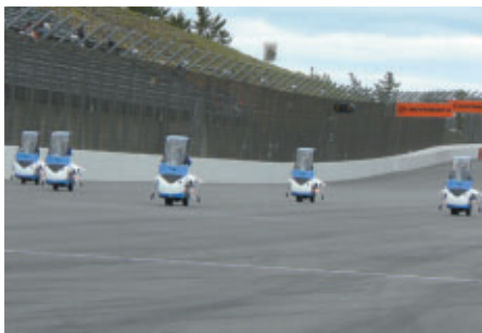
19(土)と20日(日)、2回にわたって楽しい展示飛行を 披露してくれた航空自衛隊ブルーインパルスJr.