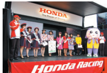
茨城県観光PRの出演者一同がHondaブースでPRタイム