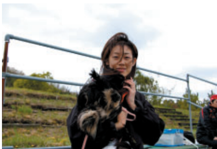
京都からお越しのお客様は宇都宮に住むお兄さん宅から 愛犬とともにD席ワンちゃん観戦エリアにご来場です