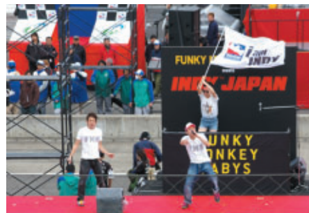
人気のヒップホップユニットFUNKY MONKEY BABYSが オープニングセレモニーに登場(19日)