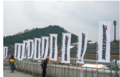
株式会社ブリヂストン