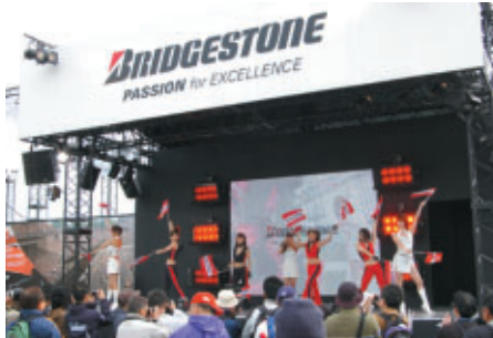
ブリヂストンブースで行われた 華やかなダンス&フラッグパフォーマンス

あいにくの天候にたたられた週末でしたが、場内はアメリカンレースならではの楽しいイベントやプロモーションアクトで大いに盛り上がりました。