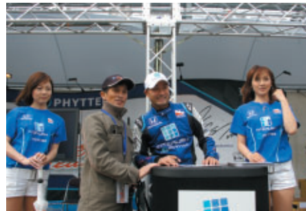
ロジャー安川選手はInterushブースで気さくにファンと記念撮影