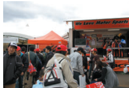
プレミアムグッズが当たるスピードくじに長蛇の列 オートボックスブース