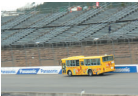
バスでスーパースピードウェイを体験走行する スペシャルプログラム(17、18日)