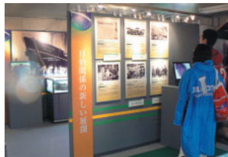
ブラジル移民100周年を記念し、写真や貴重な展示物が紹介されました