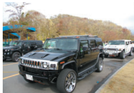
HUMMERやNASCARなどアメリカンカーが大集合(19日)