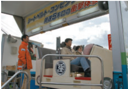
JAF(日本自動車連盟)ブースで実施された、シートベルト効果を実感できる「シートベルトコンビンサー」