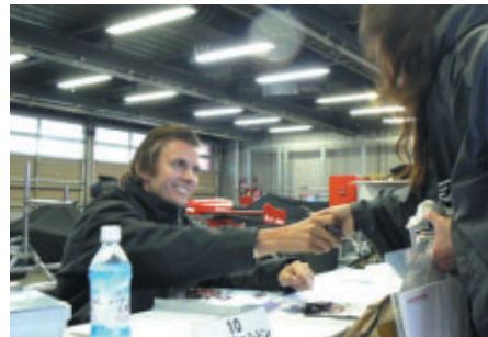
同じく18日(金)にピットで実施された全ドライバーのサイン会