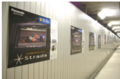
松下電器産業株式会社