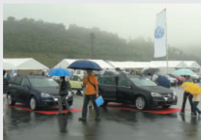
Volkswagenラインアップ展示

7月21日、東パドックを中心に「Volkswagen Meeting 2007」が開催されました。当日行われた「ゴルフGTIカップ・ジャパン」をはじめ、ニューモデルの展示・試乗や家族で楽しめるコーナーなど多彩なイベントが展開されました。