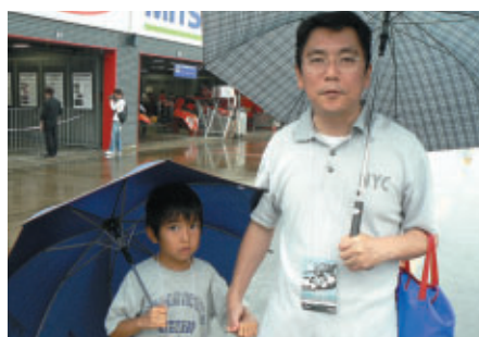
東京からお越しのお客さま モータースポーツご観戦初めてだそうです