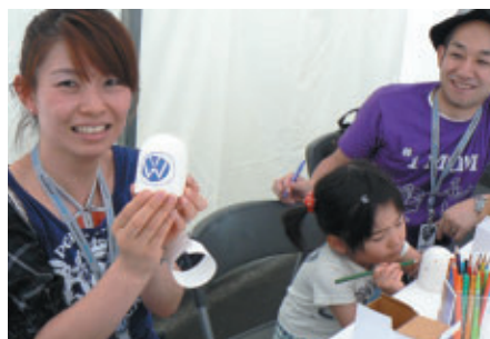
「Volkswagen Meeting」でお会いした東京からのご家族連れ ステキなVW風鈴ができました