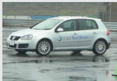
TSI体験試乗(マルチコース)