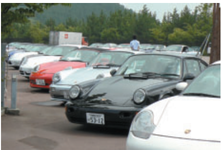
ポルシェクラブ宇都宮(グランドスタンドプラザ)