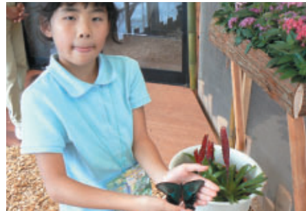
場内では夏のイベント「ガキ大将の夏」を開催中(8月26日まで) 「ふれあい昆虫王国」など楽しいイベントがいっぱい