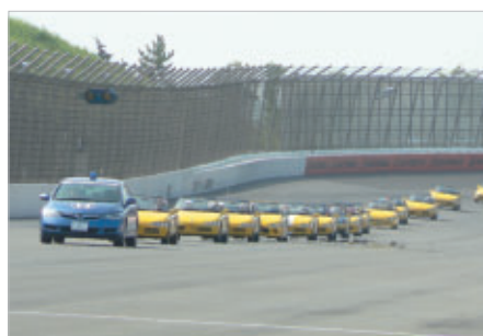
約60台が参加してスーパースピードウェイをパレードしました