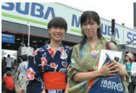
浴衣のお客さま お母さんが飯田章選手の大ファンです