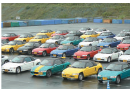
Honda ビートオーナーによるイベント「MEET THE BEET!」(南コース)