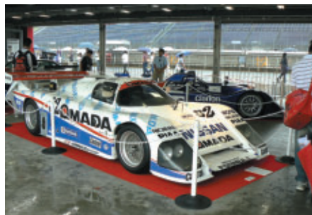
ル・マンで活躍した歴代のマシン5台が展示されました