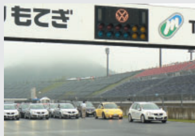
VWオーナー約140台によるパレードラン