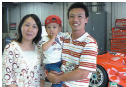
埼玉からお越しのファミリーはル・マン仕様のNSXを 目の当たりにして感激のご様子でした