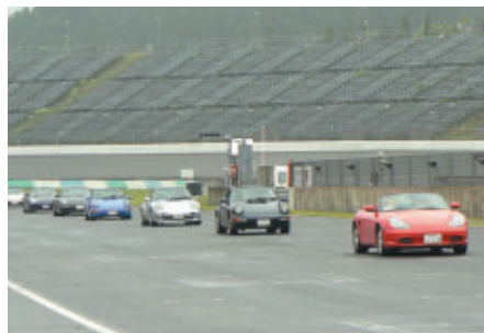
32台が参加してロードコースをパレードしました