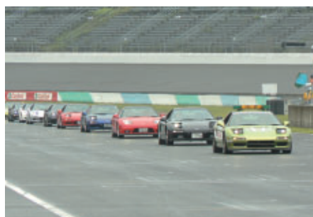
11台が参加してロードコースをパレードしました