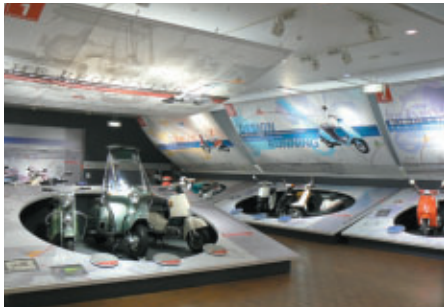
Honda Collection Hall特別展示「スクーター立体大図鑑」 日本のスクーターの進化の軌跡をご紹介します(2008年1月20日まで)