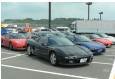
Honda NSXオーナーズクラブ(1バドック)